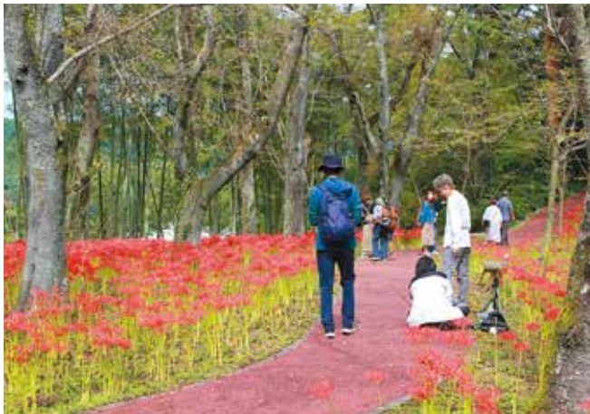
散歩や写真撮影を楽しむ来場者