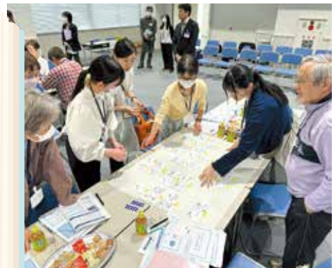
4回にわたって行われた ワークショップ