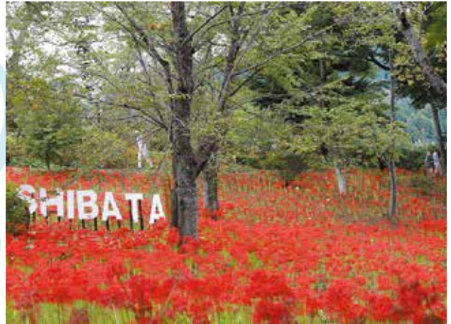
新しく設置されたフォトスポット