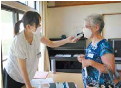
地域での口腔機能測定