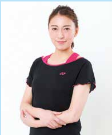
北京オリンピックバドミントン 女子ダブルス日本代表 小椋 久美子さん