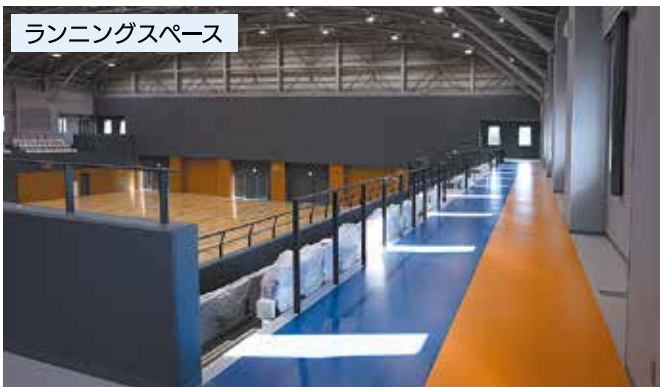
ランニングスペース