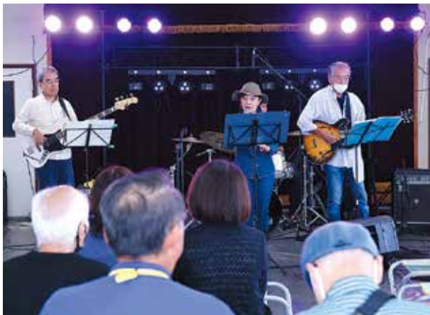
11組のバンドが個性あふれる演奏を披露しました。