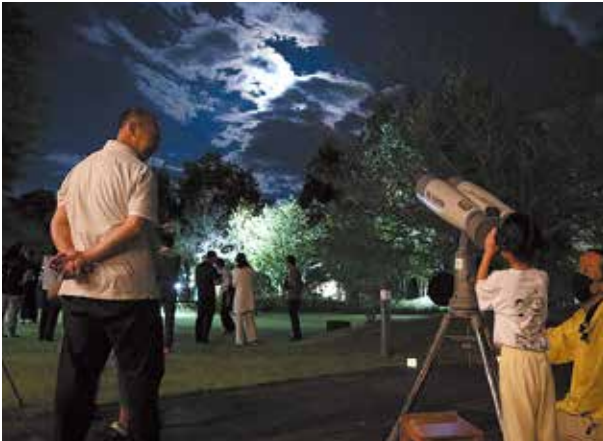
望遠鏡で月を見る来場者

9月17日(火)、しばたの郷土館で中庭観月会が開催されました。約360人が来場し、篠笛や箏、シンセサイザーの演奏を聴きながら「柴田町星を見る会」の望遠鏡で名月観望を楽しみました。また茶席では、お茶とお菓子も振舞われました。