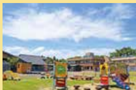
一般社団法人 柴田町観光物産協会 柴田町本船迫字上野 4-1