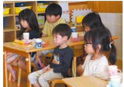
保育所でのフッ化物洗口