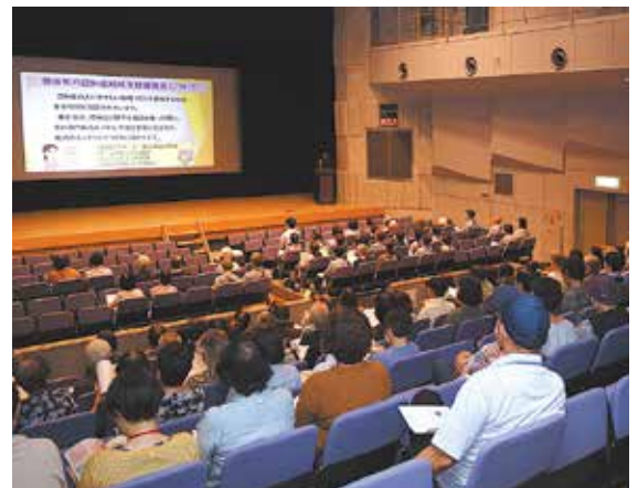
町の施策の説明を受けた後、映画を鑑賞しました。

9月27日(金)、槻木生涯学習センターで、若年性認知症と診断された方の実話をもとに製作した映画「オレンジ・ランプ」の上映会が開催されました。上映会は、認知症への理解を広めるため、認知症月間に合わせて開催されたもので、当日は町民約160人が来場しました。