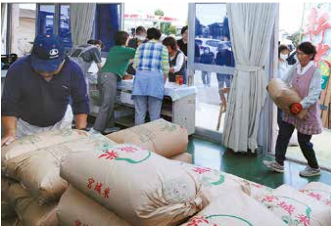
炊き立ての新米が無料で振舞われた「産直会ふ・う・ど」

映画を見た方は「認知症に対する認識が変わりました。患者を特別視せず、自分らしく生きるサポートをすることが大切だと学びました」と話していました。