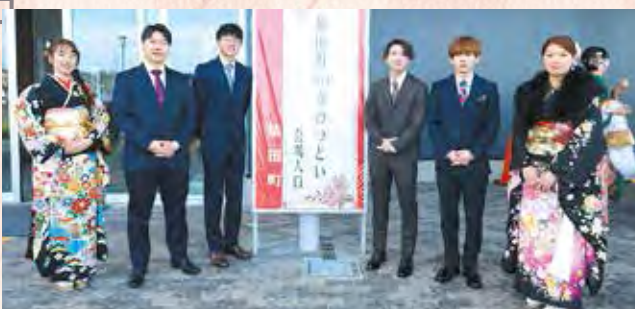
20歳のつどい実行委員会の皆さん

記憶に残る式典を作り上げるため、「恩師からのビデオレター」の撮影・編集や「20歳のメッセージ」の発表などの準備を進めてきました。