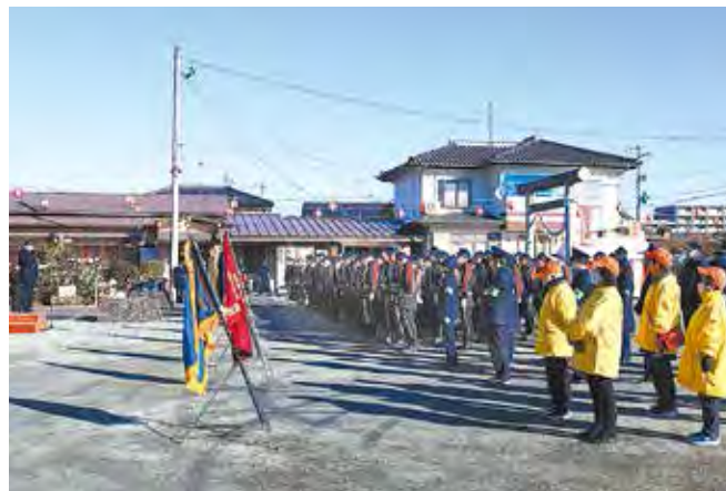
青空のもと行われた出初式