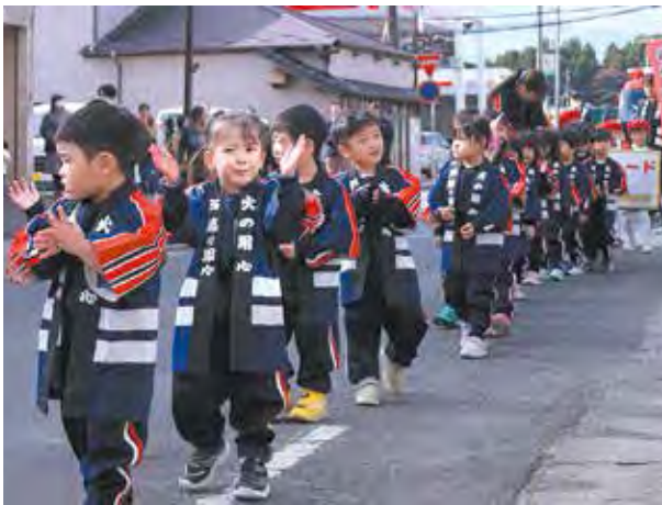
昨年11月に行われた消防防火パレード