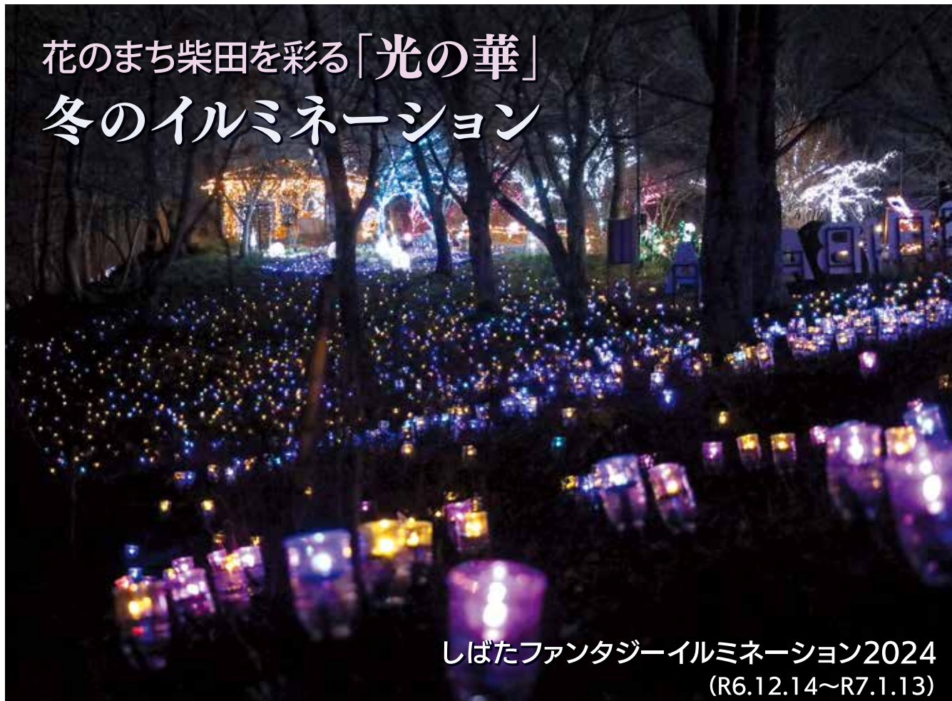
しばたファンタジーイルミネーション2024 (R6.12.14~R7.1.13)