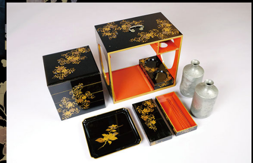
13代意利（もととし）所用 堤重

展示解説 3/22（土）、4/12（土）、5/24（土）/10：00～ / 無料 申込不要