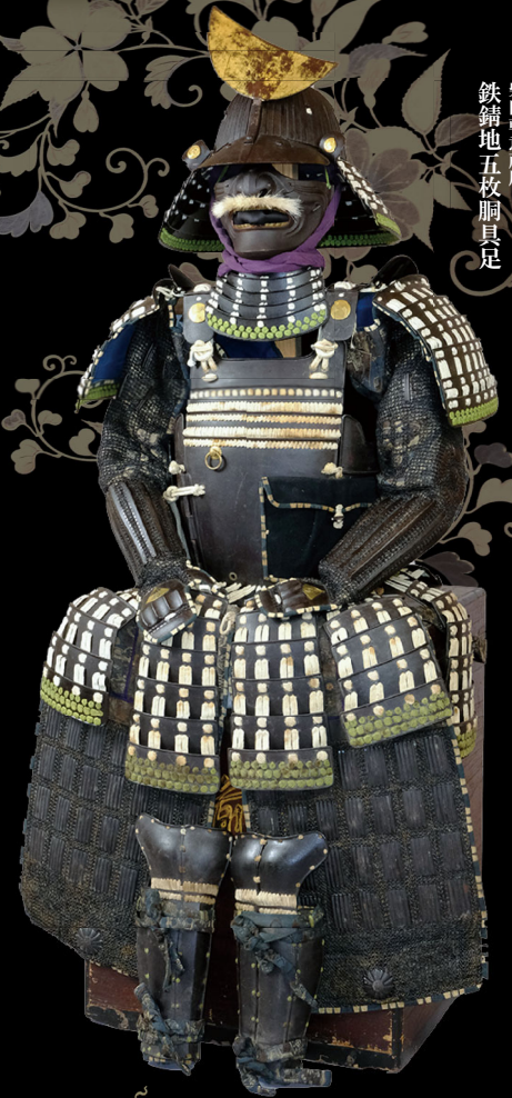
柴田朝意所用 鉄鎧地五枚胴具足