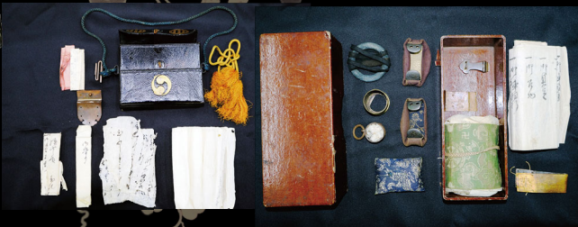
鎧と共に見つかった御守りなどの文書