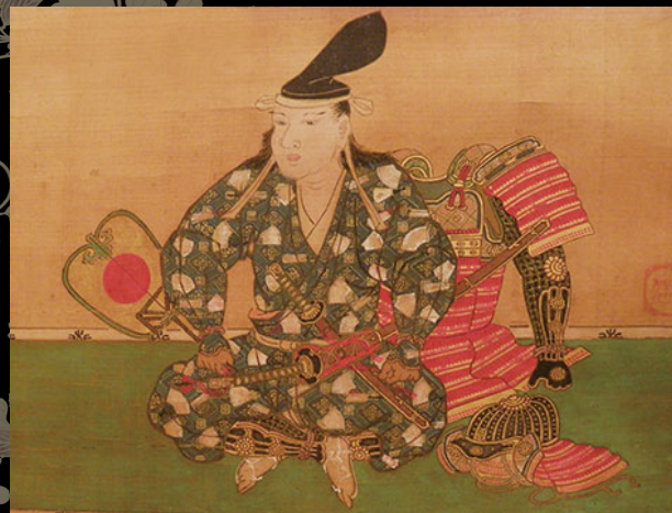
狩野清信筆 柴田外記朝意 部分（個人蔵）